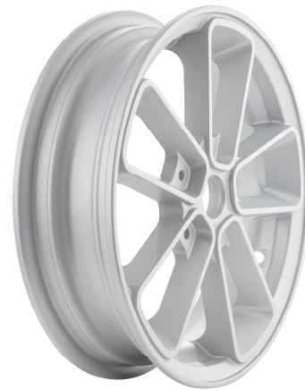
SIP 6508 Silber / SIP 6508 Silver