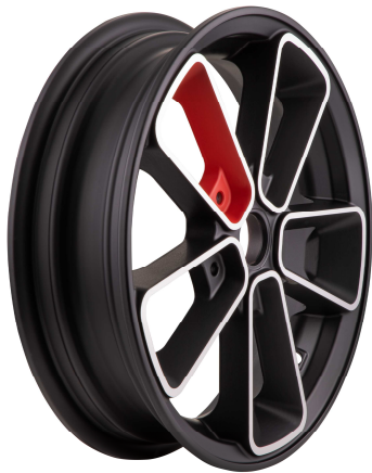
SIP 6508 Schwarz-Rot / SIP 6508 Black-Red

Rad SIP 6508 in verschiedenen Farbvarianten (weitere Farbvarianten zulässig): / Wheel SIP 6508 in various colours (further colours permissible):